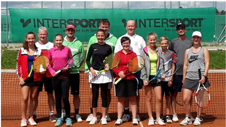
Im Bild die Teilnehmer bei der Mixed-Meisterschaft